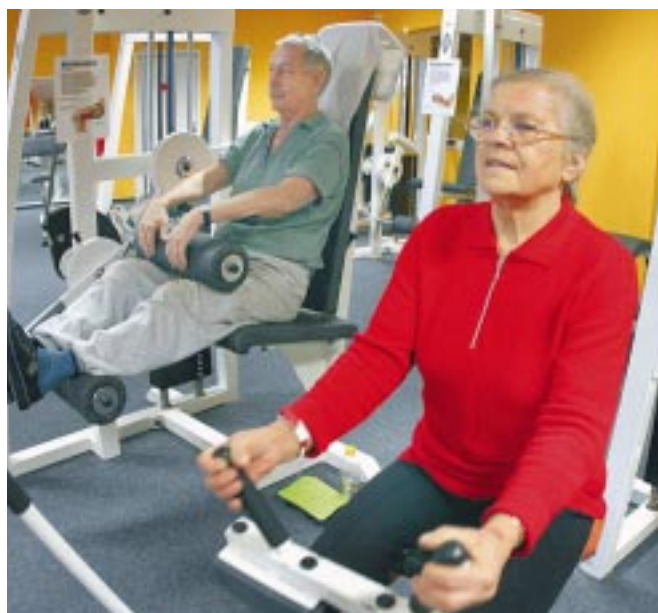
Rééducation active dans un service de soins de suite et réadaptation (SSR) gériatrique.

En dehors de l'hospitalisation, la consultation gériatrique, faisant partie intégrante de cette filière, permet d'avoir une évaluation globale des sujets âgés afin d'anticiper les situations pathologiques graves et d'éviter au maximum les hospitalisations. Cette consultation spécialisée se situe comme un complément au suivi du médecin traitant. Celui-ci reste le référent médical du malade et le gériatre travaille toujours en lien avec lui. Il peut apporter une aide pour hiérarchiser les maladies chroniques et les traitements au long cours, et pour repérer les situations de fragilité. Cette consultation