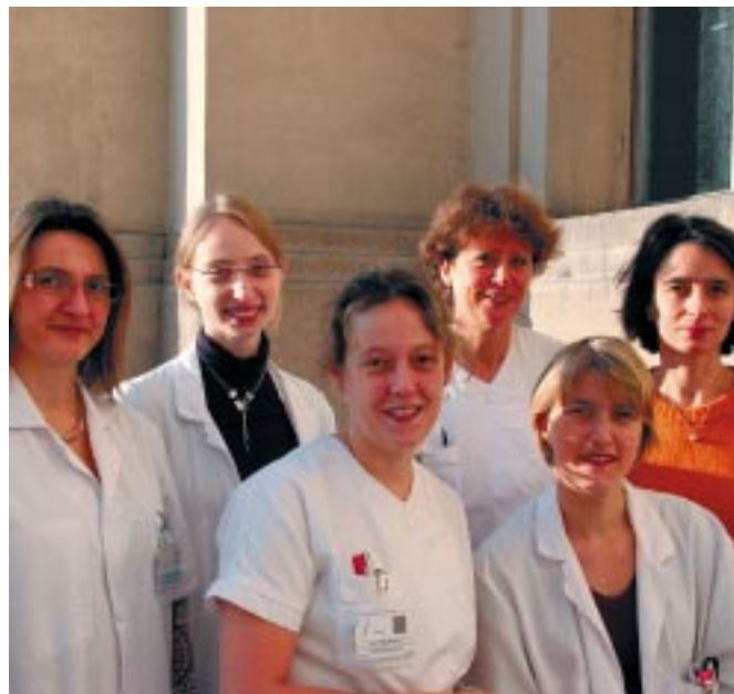
L'équipe mobile de gériatrie, décembre 2007.

En effet, les sujets âgés de plus de 75 ans représentent 6,7 %