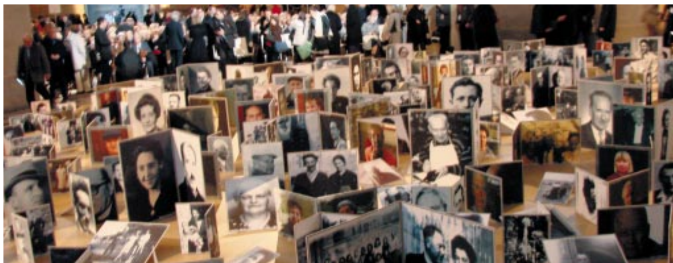
Les portraits des Justes de France qui sont entrés au Panthéon de la nation.

parmi les nations" à la tribune du Conseil Economique et Social. En 2006, une place "Justin Godart" est inaugurée par la Ville de Paris dans le 6 e arrondissement. Le 18 janvier 2007 les Justes de France entrent au Panthéon, sous la présidence de Monsieur Jacques Chirac.