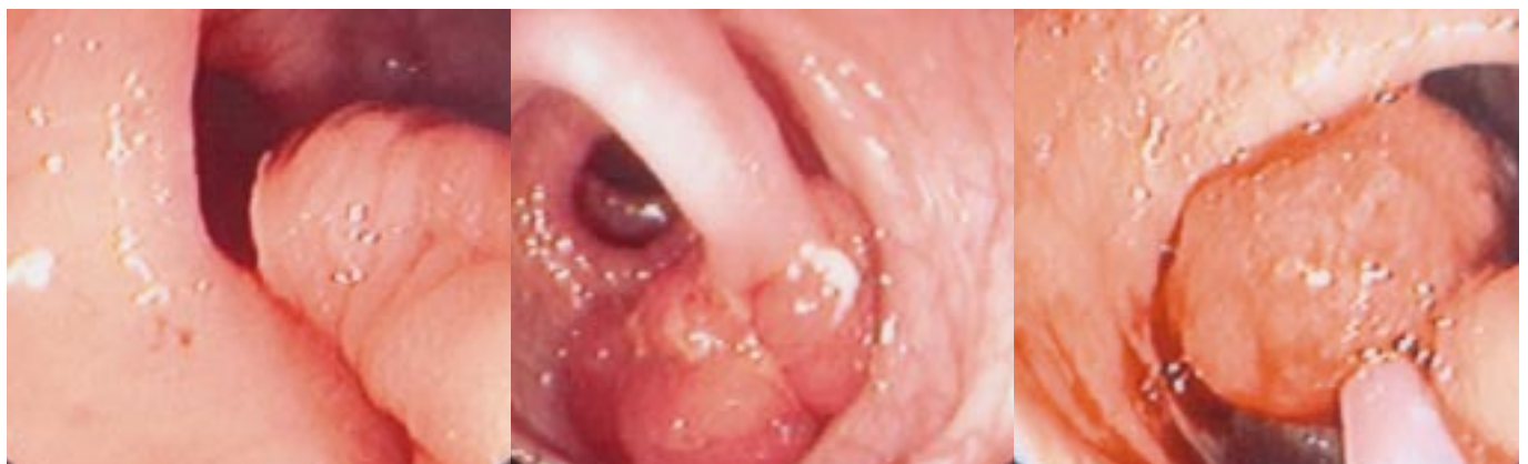
De gauche à droite : polypectomie, polype pédiculé, polype exérèse.