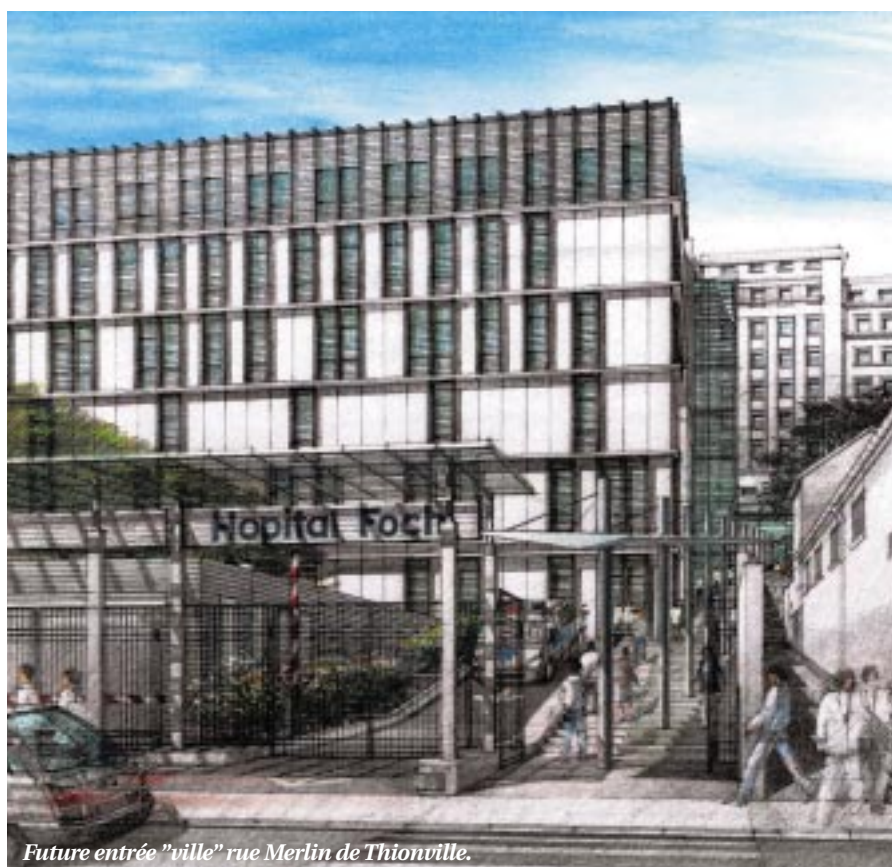
Future entrée "ville" rue Merlin de Thionville.