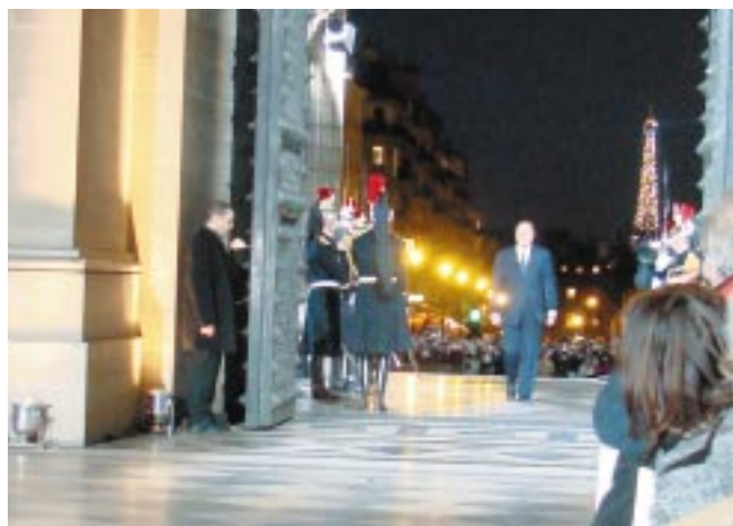
Entrée de Jacques Chirac pour la cérémonie du 18 janvier 2007.

Justin Godart, notre premier Président, est l'un des pères de la Fondation. Un humaniste et un visionnaire. Né en février 1871 à Lyon, docteur en droit en 1901, il devient avocat. En 1904, il est adjoint au maire de Lyon, puis élu député en 1906. Il le restera pendant 22 ans, jusqu'en 1927. De 1915 à 1918, comme sous-secrétaire d'État à la Guerre, il dirige le service de santé militaire. En 1918, il crée la Ligue française contre le cancer dont il sera président jusqu'en 1956. En 1924-1925 il est ministre du Travail et de l'Hygiène. En 1925, il fonde l'Association France-Israël, puis, après la guerre, est co-fondateur du centre de documentation juive contemporaine, président d'honneur, fondateur du Mémorial Juif, et, à la naissance de l'État d'Israël, désigné comme conseiller juridique de l'État israélien. En 1927, il entre au Sénat, où il restera, régulièrement réélu, jusqu'à sa mort en 1956, à 85 ans. En 1934, il est nommé président du Bureau International du Travail à Genève. Mars 1939 voit son élection à l'Académie de médecine. En novembre 1940, il entre dans la clandestinité et est recherché par la Gestapo. À la libération, à 73 ans, il est maire de Lyon et, en 1948, président du B.I.T. à San Francisco. À côté de son activité débordante, il trouve encore le temps d'écrire de nombreux ouvrages. Le 29 mars 2004, il est reconnu "Juste