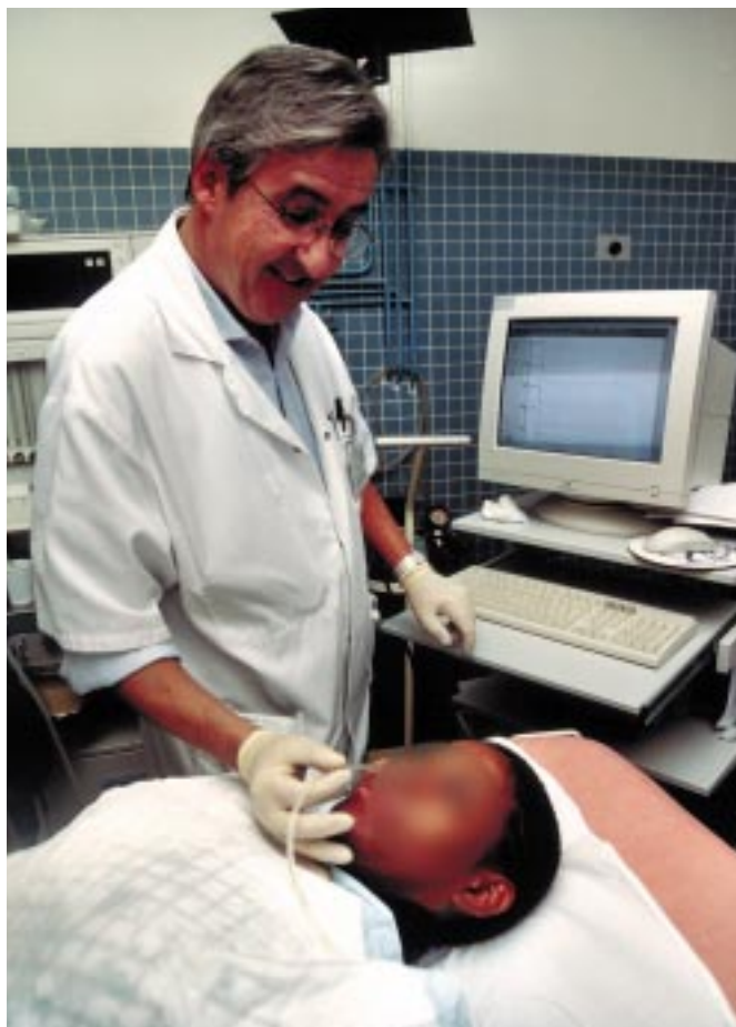
Réalisation d'une manométrie œsophagienne.