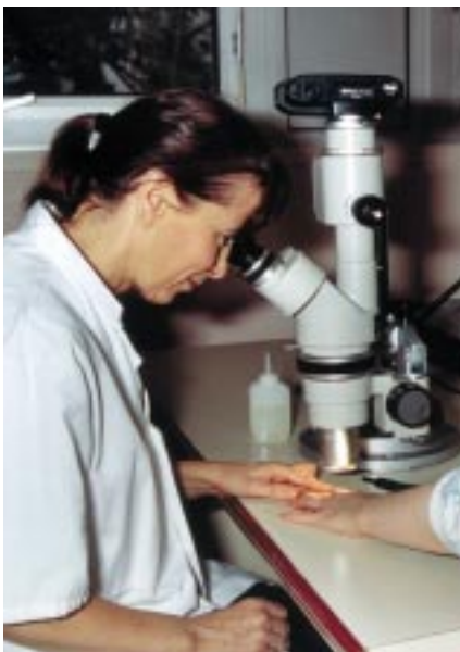
La capillaroscopie peut aider au diagnostic de maladie de système.

L'interniste doit donc être capable aussi bien de prendre en charge une fièvre qui dure lorsque l'état général du patient ne permet plus son maintien à domicile, que de dépister derrière des symptômes apparemment banals, une maladie rare : une inflammation des petites artères, devant un asthme sévère apparu à l'âge adulte (c'est l'angéite allergique de Churg et Strauss), ou une surcharge en fer congénitale