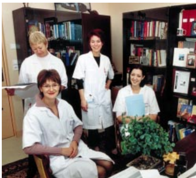
Le secrétariat du service de médecine interne de l'hôpital Foch.