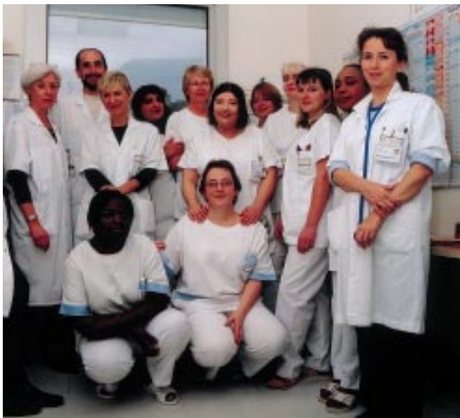
Médecins et soignantes des deux unités d'hospitalisation traditionnelle.

Dans l'autre moitié des cas , nous recevons les patients admis aux urgences de notre hôpital, soit directement, soit après passage pendant 24 à 72 heures dans un service de surveillance rapprochée (service "Porte"), ou, même, en réanimation. Les motifs fréquents d'hospitalisations sont les pathologies infectieuses (pyélonéphrite, pneumonies diverses, infection streptococcique des membres inférieurs, encore appelée érysipèle, ou infections plus graves comme infection vertébrale ou des valves cardiaques), les phlébites, les anémies... Le recrutement, à partir des urgences, a deux corollaires.