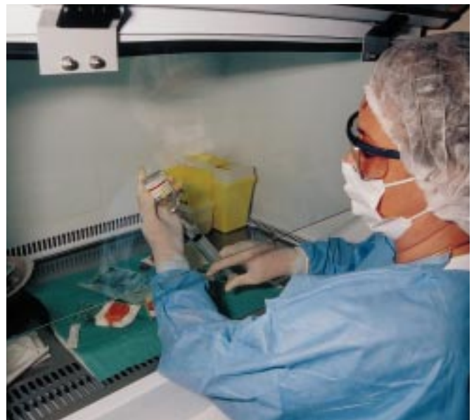
Préparation d'une chimiothérapie sous hotte.